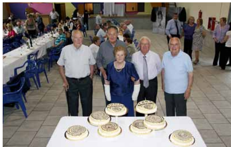
25 ANYS DE DANSA.